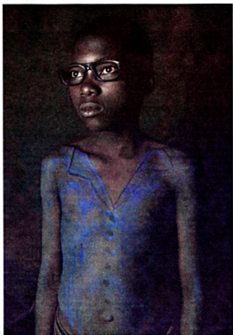
Translations (Mali). De droom van een jonge Malinees.

Beckett was gefascineerd door het theatrale aspect van zo'n omgeving, zegt ze. Om de acteurs zich nog beter in hun rol te laten inleven wordt het filmset-achtige dorp Medina Wasl genoemd en iedereen geeft ze een identiteit mee – alsof het allemaal avatars zijn uit een videogame. Jihad Hanif Alrawi is 'middenstander, 4 broers. Verloor zijn vrouw bij een zelfmoordaanval en steunt daarom de